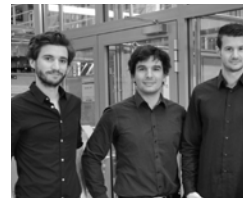
Efficient Energy Technology - E²T