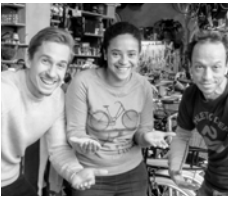
MiRa - das mitwachsende Kinderrad