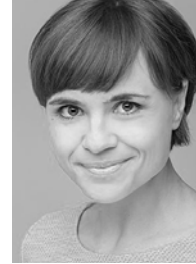
Mari Lang Moderation