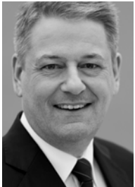
Andr  Rupprechter Bundesminister f r Land- und Forstwirtschaft, Umwelt und Wasserwirtschaft