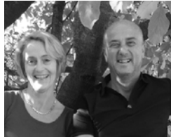
ALLMENDA green mobile