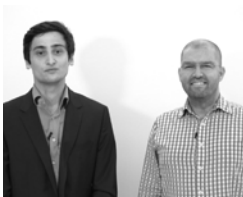
Fahrrad der Zukunft